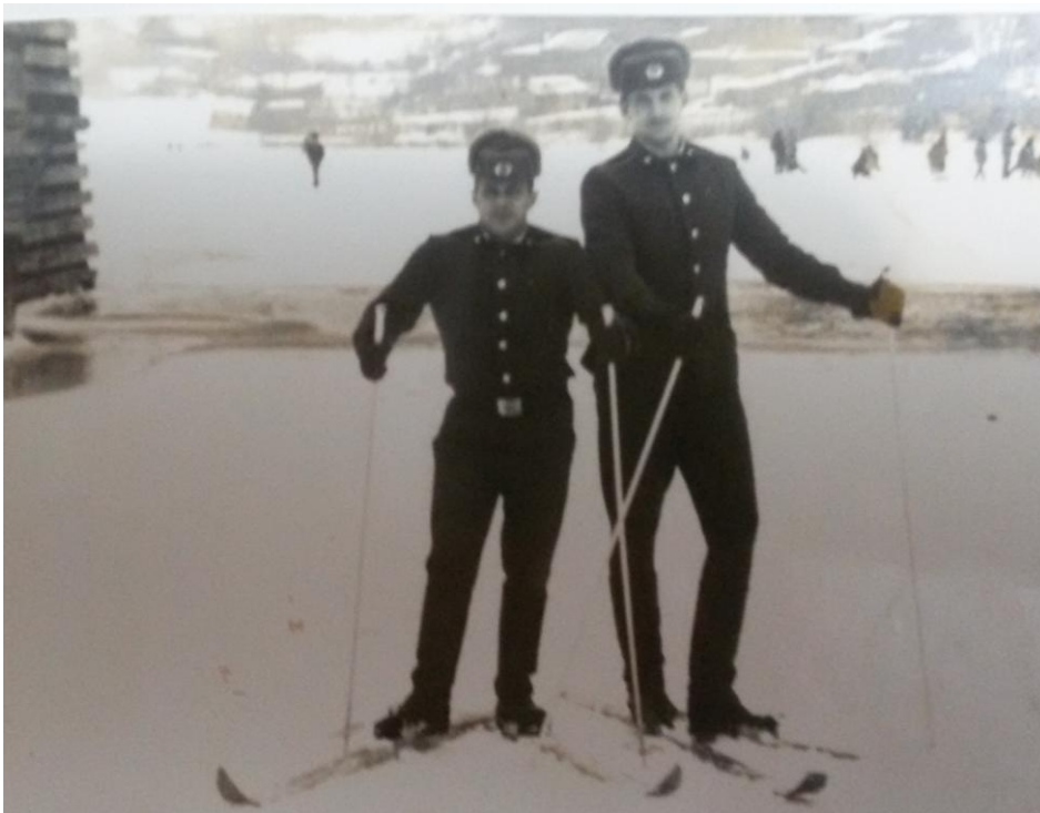
Мешканцям півдня України важко було навчитися ходити на лижах