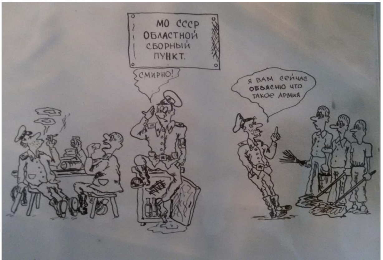
На обласному збірному пункті. Малюнок авторства Г.В.Козлова с випускного альбому училища. Саме після цієї події у 1985 році його виключили з кандидатів у члени КПРС