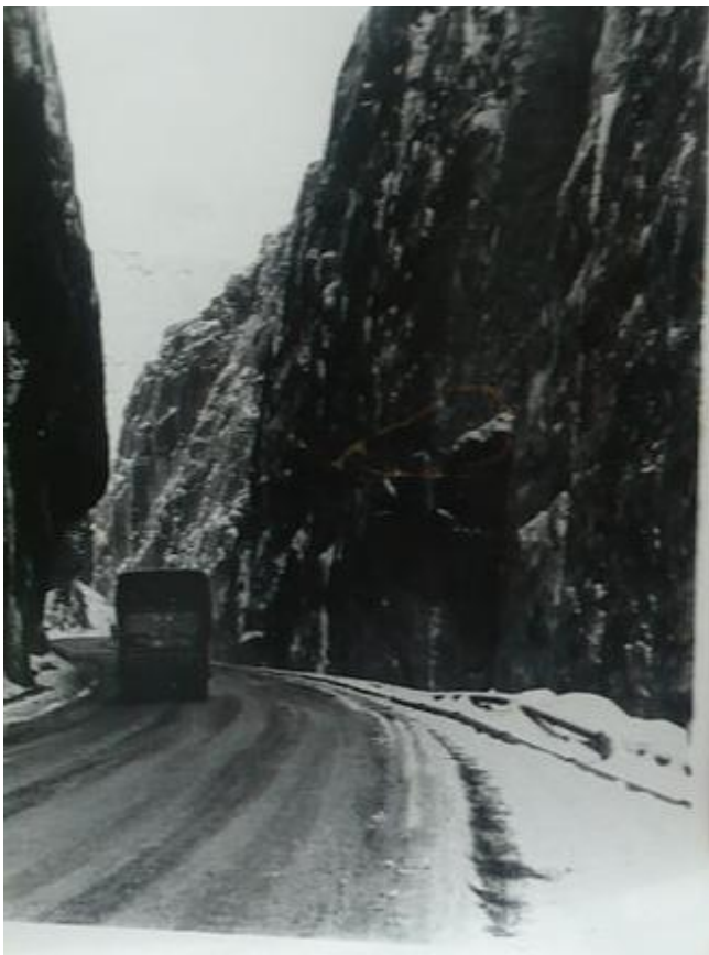
Гірська траса в Афганістані