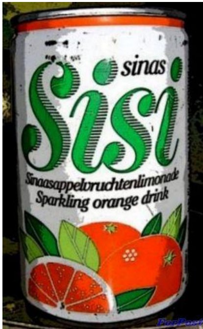
SiSi – газований напій воїнів-афганців в алюмінієвих бляшанках