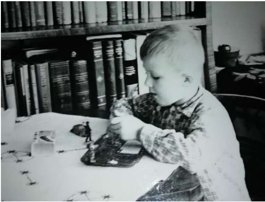
Малий Тарас на фоні домашньої бібліотеки, граючись олов'яними солдатиками