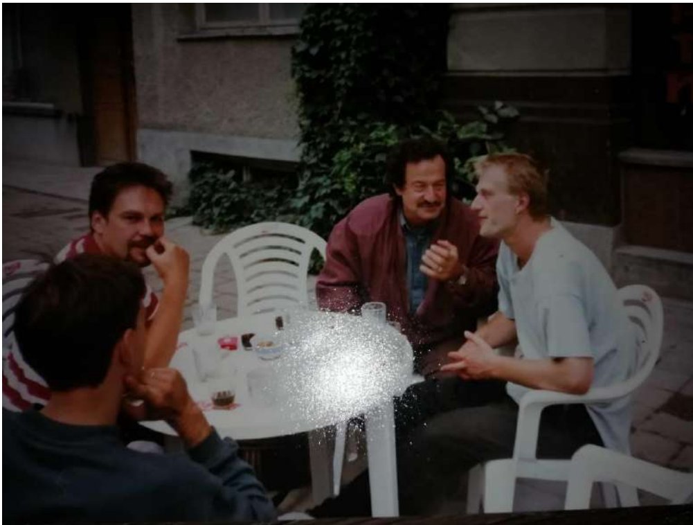
В компанії друзів. Разом з Юрієм Андруховичем