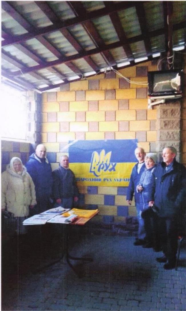
Під час роботи на агітаційному пункті