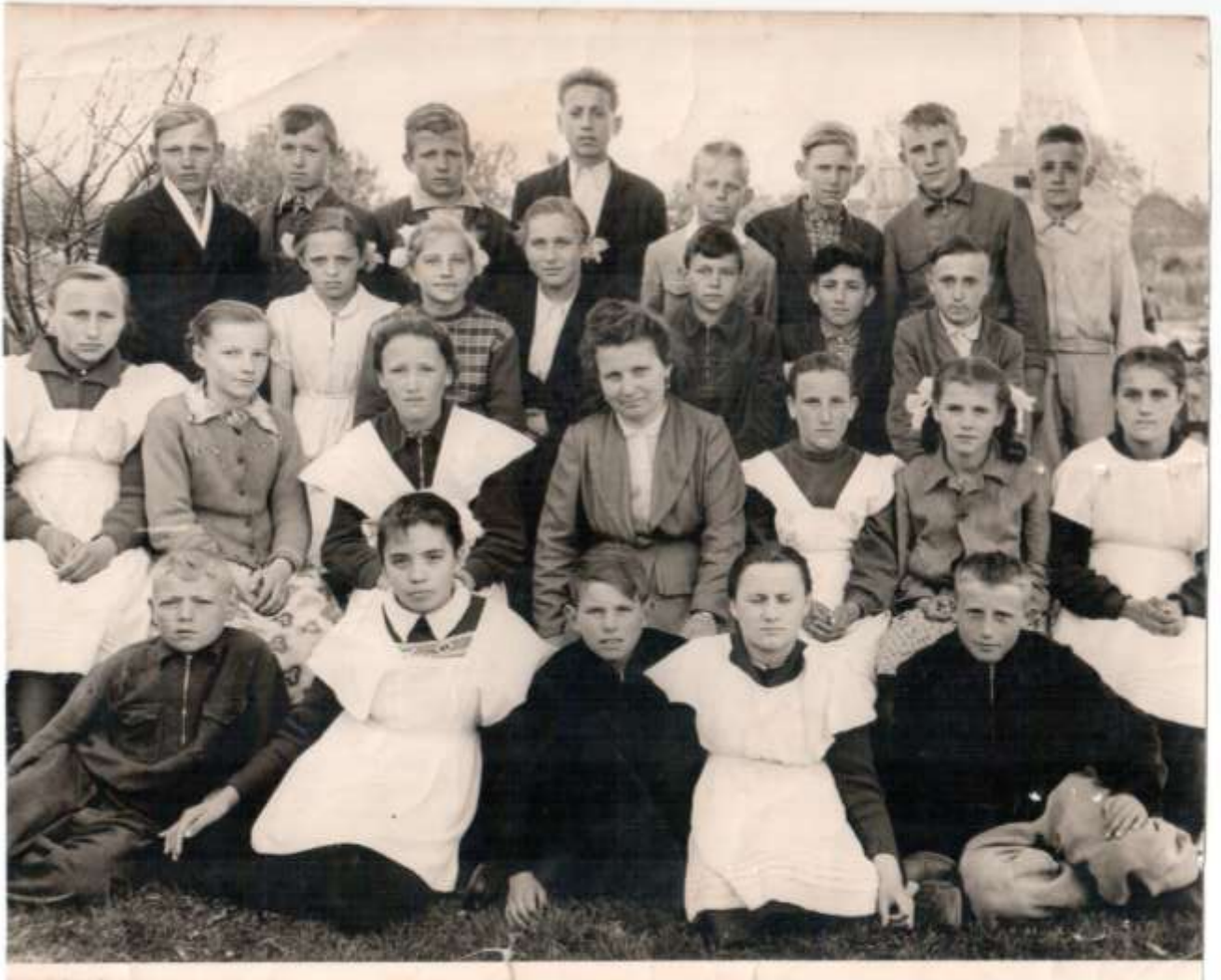
1961 рік. Наша респондент у 6 класі (друга зліва у нижньому ряду)